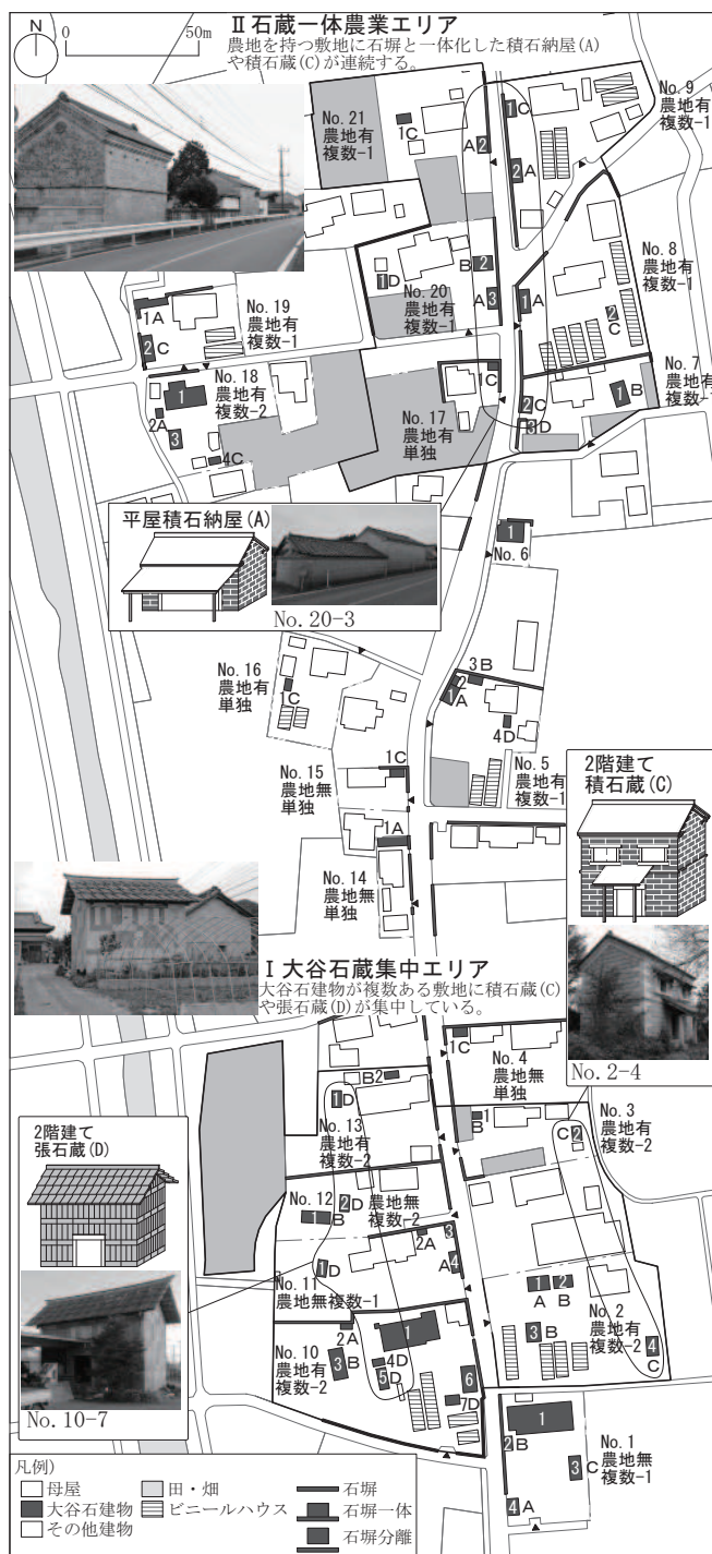
図2 農村集落における大谷石建物もある町並みの構成